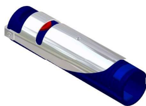
Peça nº 0100301835